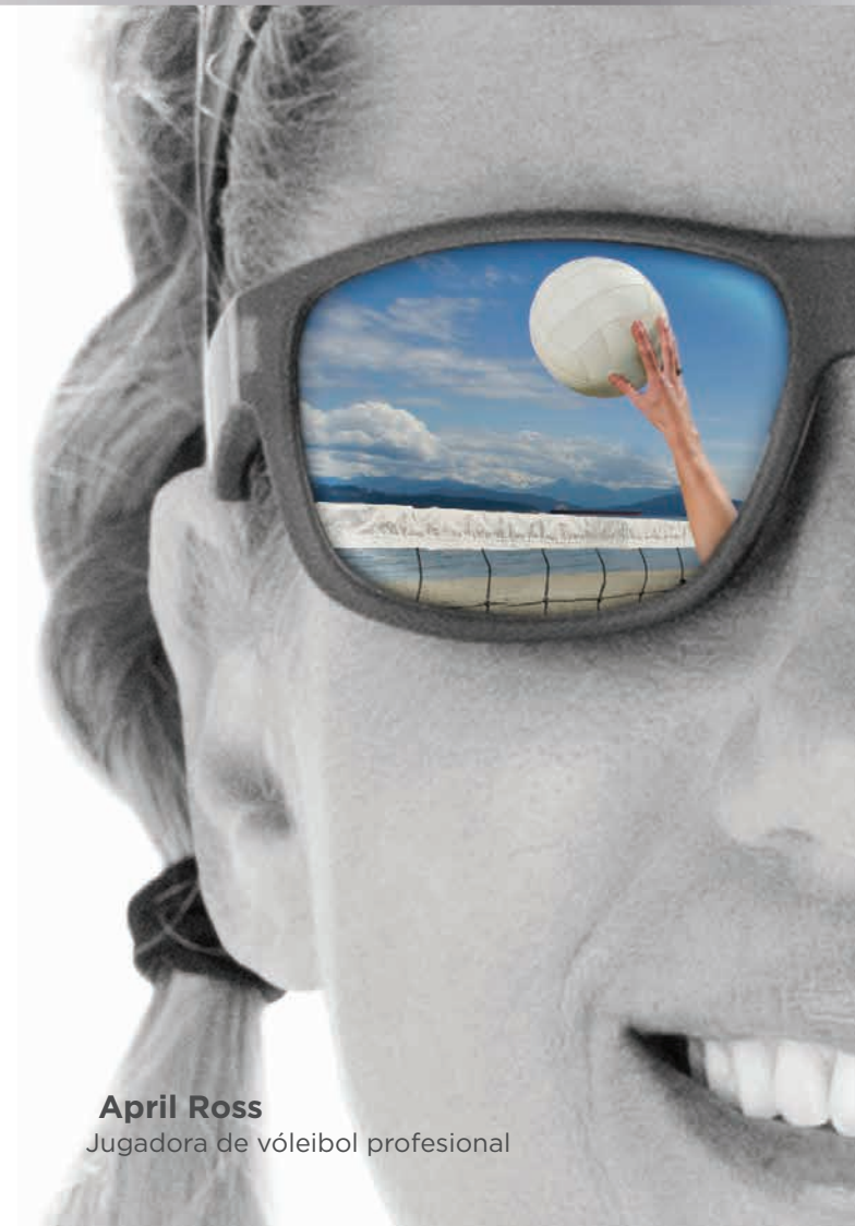
April Ross Jugadora de vóleybol profesional

©2016 Essilor of America, Inc. Todos los derechos reservados. A menos que se indique lo contrario, todas las marcas comerciales son propiedad de Essilor International y sus subsidiarios en los Estados Unidos y en otros países. Transitions y the swirl son marcas comerciales registradas de Transitions Optical, Inc., utilizadas bajo licencia por Transitions Optical Limited. El rendimiento fotocromático está influenciado por la temperatura, la exposición a rayos UV y el material del lente. LXPE000392 SHK/SSX 10/16